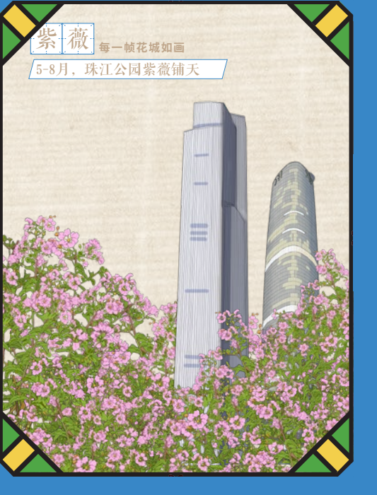
紫薇 每一帧花城如画 5-8月，珠江公园紫薇铺天