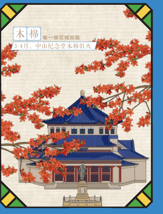
木棉 每一帧花城如画 3-4月，中山纪念堂木棉似火