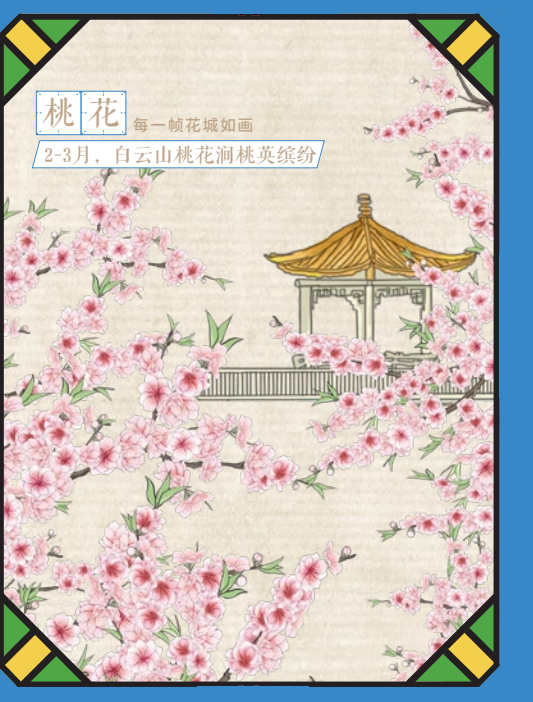
桃花 每一帧花城如画 2-3月，白云山桃花涧桃英缤纷