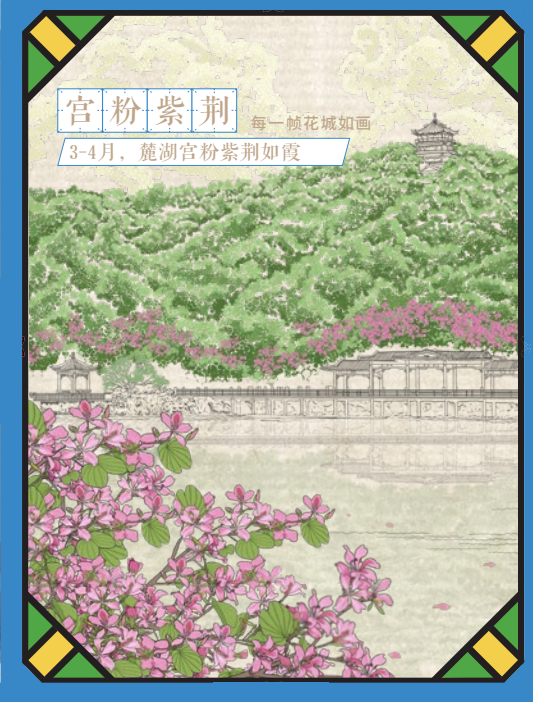
宫粉紫荆 每一帧花城如画 3-4月，麓湖宫粉紫荆如霞