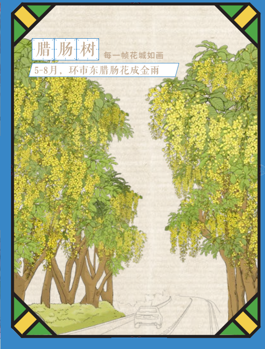
腊肠树 每一帧花城如画 5-8月，环市东腊肠树成金雨