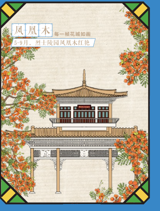
凤凰木 每一帧花城如画 5-9月，烈士陵园凤凰木红艳