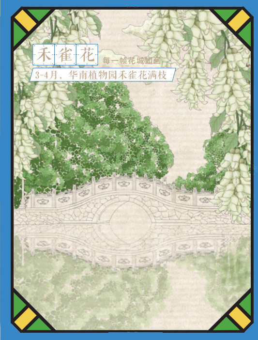
禾雀花 每一帧花城如画 3-4月，华南植物园禾雀花满枝