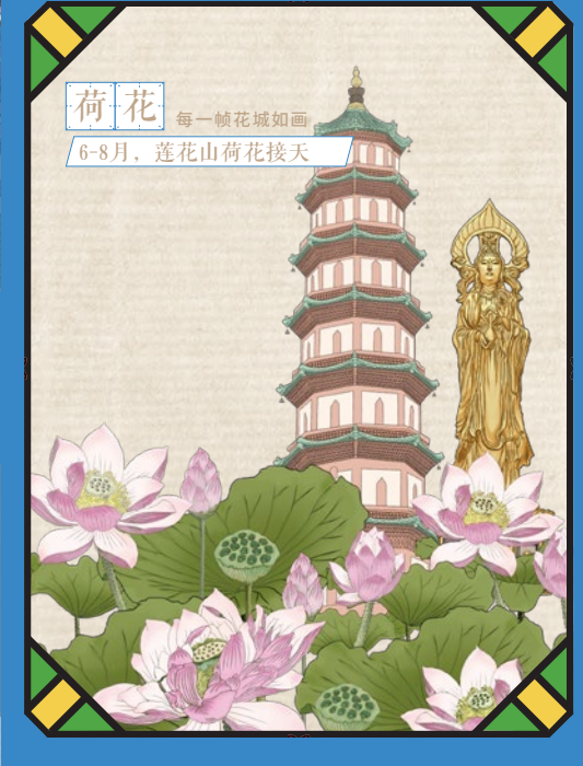
荷花 每一帧花城如画 6-8月，莲花山荷花接天