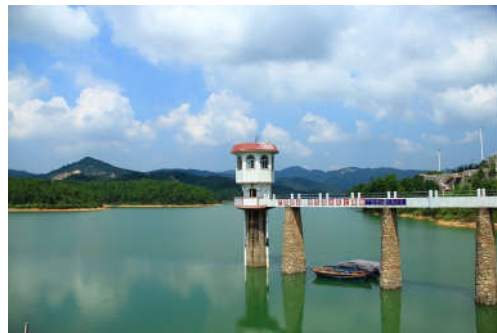
图 7-6 福源水库 (二)