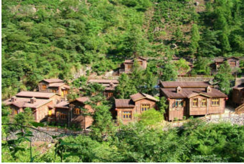
图 7-37 九龙潭水上世界度假村