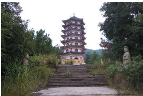
图 7-1 高百丈风景区

梯面镇森林小镇建设指标达标情况良好，可对各项指标进行巩固和提升，促进其绿色发展。建设指标见表 7-1。