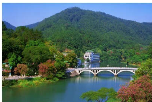
图 7-26 碧浪虹桥