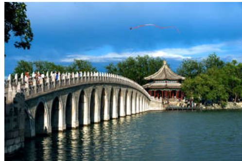
图 7-30 颐福园风景