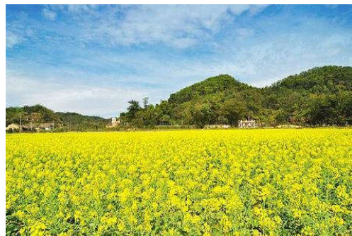
图 7-2 红山村