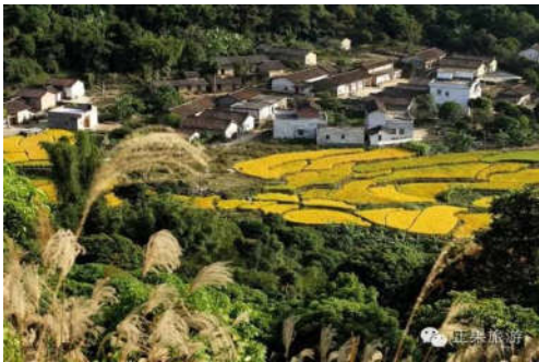
图 7-21 正果畲族村