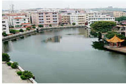
图 7-34 石碁镇河流