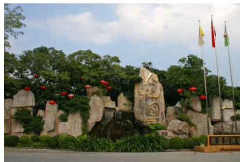
图 7-24 仙沐园温泉