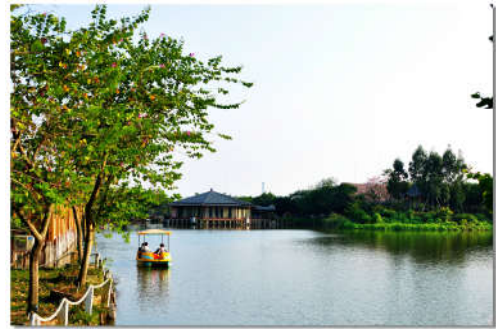
图 7-40 永乐农庄