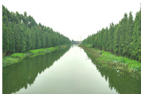
图 7-10 西涌水岸绿化