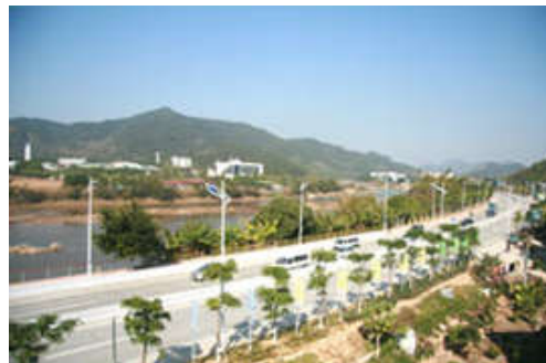
图 7-44 105 国道良口段