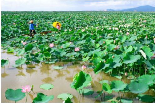
图 7-39 万顷荷香