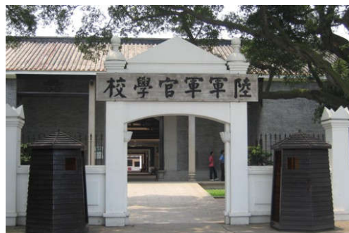
图 7-32 黄埔军校