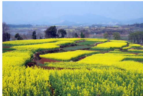
图 7-22 油菜花海