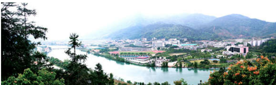
图 7-45 良口镇全景图