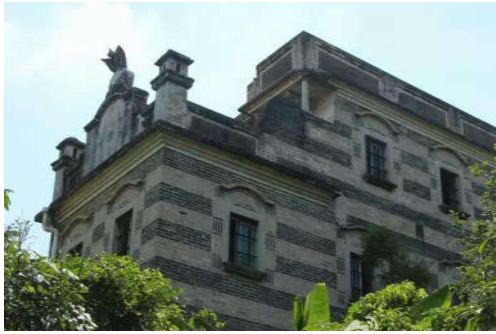
图 7-7 花山碉楼群（一）