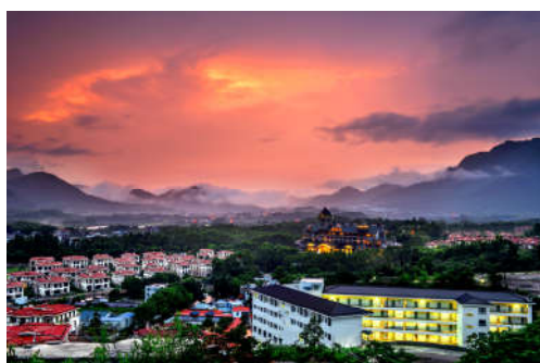
图 7-19 高山晚霞