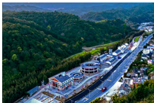
图 7-46 莲麻特色小镇图