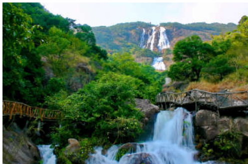
图 7-17 白水寨

派潭镇生态本底好，且绿化条件好，森林小镇建设指标达标情况良好，可对各项指标进行巩固和提升。建设指标见表 7-5。