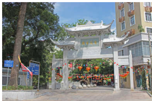
图 7-31 金花古庙牌坊