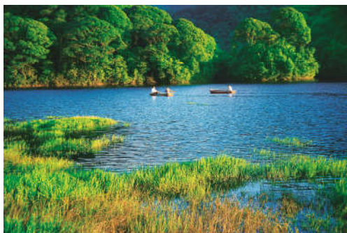
图 7-23 石门国家森林公园

通过森林公园、森林康养示范基地、森林人家等建设，完善基础设施，进一步提高镇区生态旅游场所建设水平，同时注重建设旅游文化特色村，将温泉镇南平村、温泉镇温泉村打造成为旅游文化特色村。此外，完善生态标识系统，突出温泉森林小镇特色。