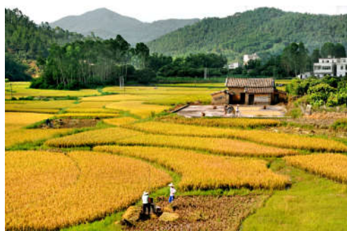
图 7-15 收获季节