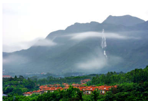
图 7-20 仙瀑倩影