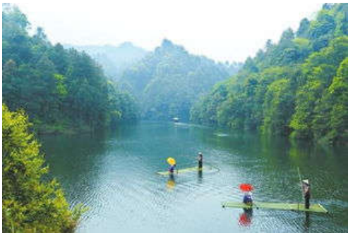
图 7-29 小石船风景旅游区