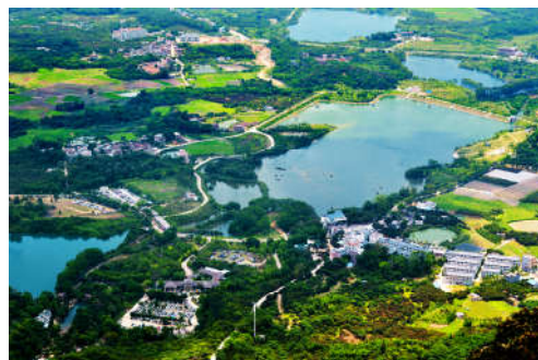
图 7-18 石马龙湿地公园