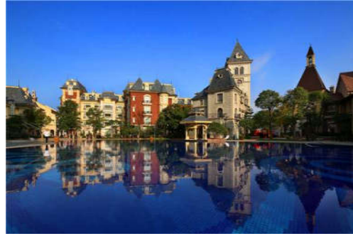
图 7-38 九龙湖度假村