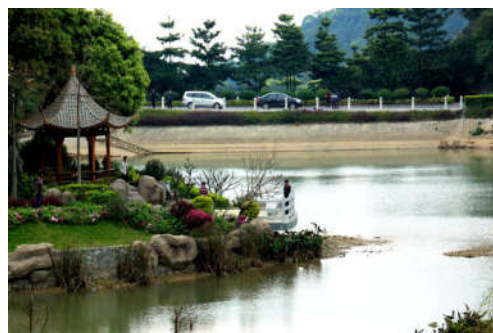
图 7-27 帽峰山森林公园风景（一） 图 7-28 帽峰山森林公园风景（二）