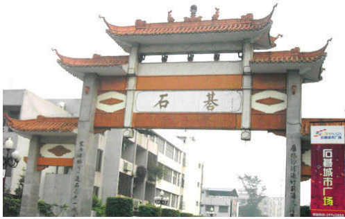
图 7-33 石碁牌坊