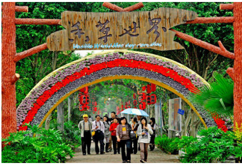
图 7-3 香草世界景区 (一)