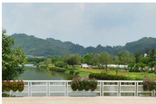
图 7-9 蕉门湿地公园