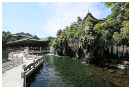
图 7-35 宝墨园