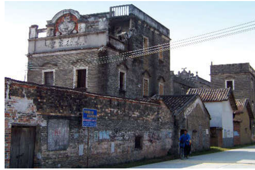
图 7-8 花山碉楼群（二）