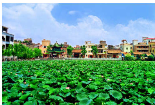
图 7-11 莲溪村荷花塘