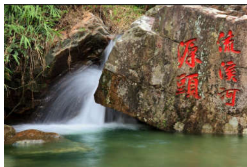
图 7-47 桂峰村流溪河源头图