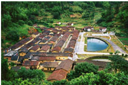
图 7-43 良口美丽乡村