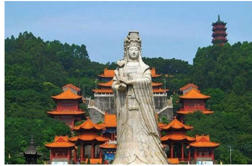
图 7-42 何仙姑旅游景区