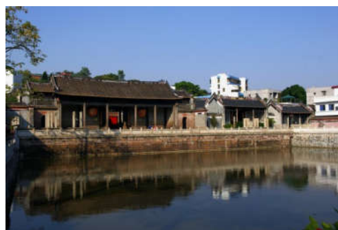
图 7-36 沙湾古镇