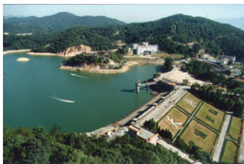
图 7-25 天湖秀色