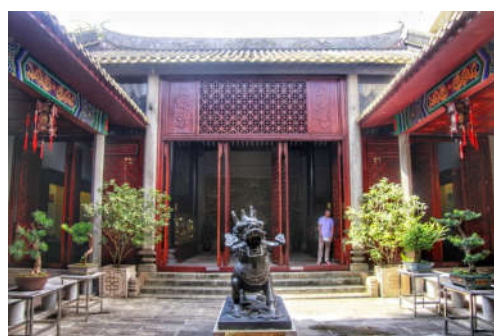
图 7-12 麒麟文化展示馆内