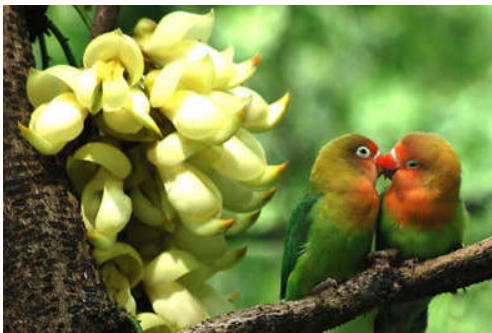
图 7-5 福源水库 (一)