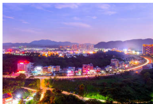
图 7-14 醉美中新