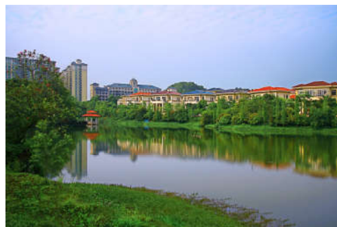
图 7-16 绿色家园