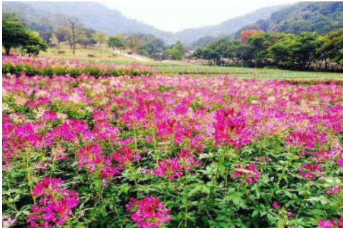
图 7-41 二龙山生态园