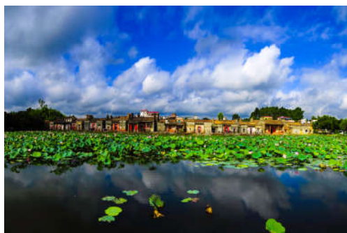
图 7-13 坑贝古村